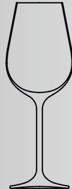
Weisswein 35 cl white wine 35 cl Art.-Nr. 619.621