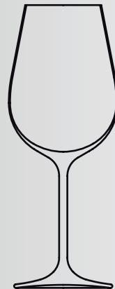
Rotwein 54 cl red wine 54 cl Art.-Nr. 619.614