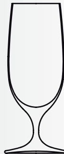
Bier 36 cl beer 36 cl Art.-Nr. 619.638