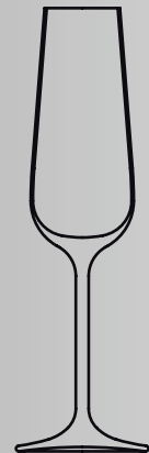
Sektkeilch 18 cl champagne 18 cl Art.-Nr. 619.591